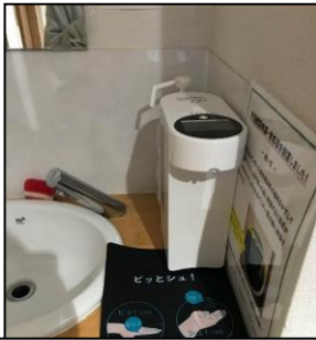
1F 非接触型検温消毒器