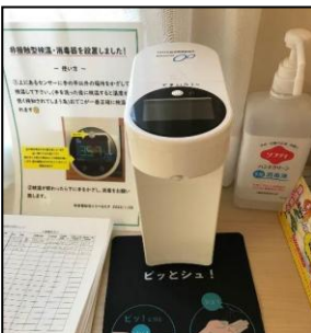
2F 非接触型検温消毒器