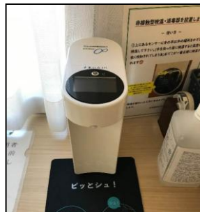
3F 非接触型検温消毒器