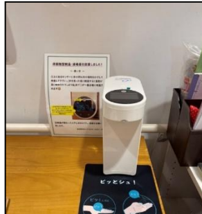
2F 非接触型検温消毒器