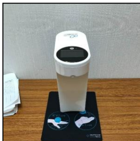
非接触型検温消毒器