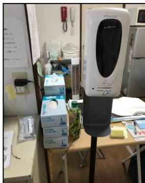
105号室 自動手指消毒