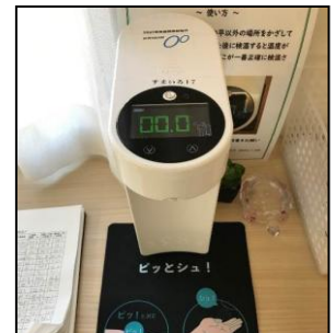
4F 非接触型検温消毒器