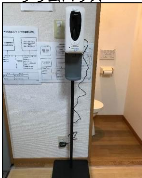
103号室 自動手指消毒