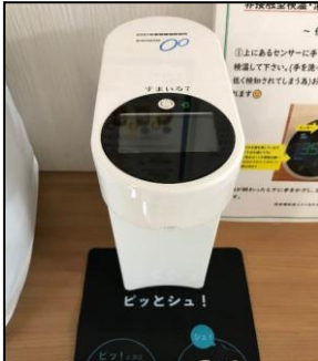
IF 非接触型検温消毒器