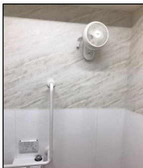
サーキュレーター②