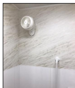
サーキュレーター③