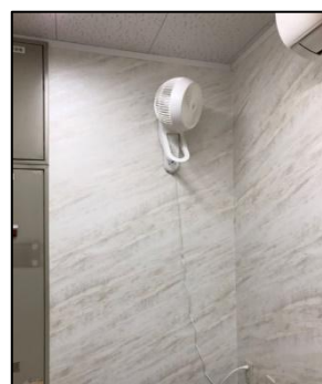
サーキュレーター⑥