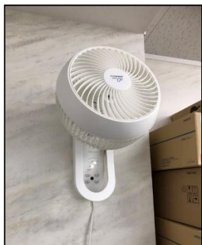
サーキュレーター①