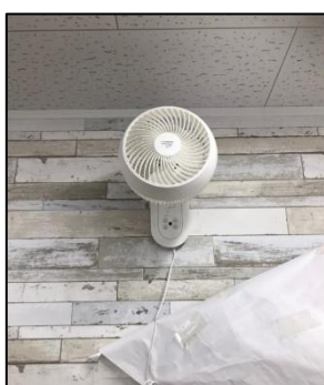
サーキュレーター⑤