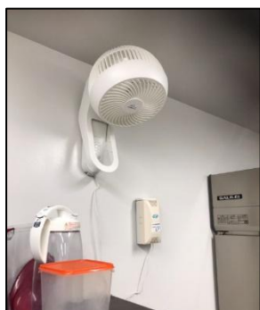
サーキュレーター④