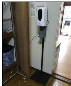
106号室 自動手指消毒