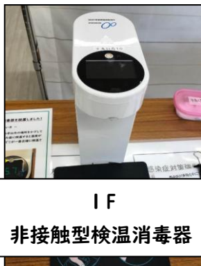
IF 非接触型検温消毒器