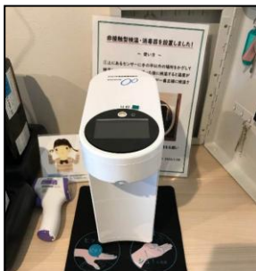
1F 非接触型検温消毒器