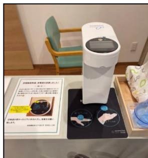
2F 非接触型検温消毒器