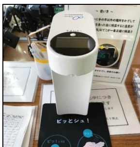
1F 非接触型検温消毒器